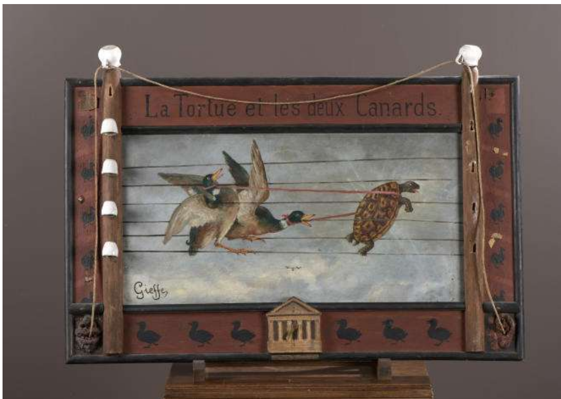
« La Tortue et les deux Canards, d'après La Fontaine (Molière) », de Gieffe (pseudonyme de Jules Foloppe), huile sur carton, cadre en bois peint agrémenté de papiers découpés et collés, papier mâché, éléments de dinette en céramique, cordelette. GALERIE JOHANN NALDI

Du même encore, quatre bas-reliefs de bois teinté alignent des profils féminins et masculins, collection de type comique. Le caricaturiste Boquillon Bridet (1859-1886) et le peintre Paul-Eugène Mesplès (1849-1924), jadis connus pour ses planches d'histoire naturelle pour l'un, ses figures de danseuses et de courtisanes pour l'autre, figurent aussi dans l'ensemble, et là encore, il est facile de les retrouver dans les catalogues des Arts incohérents.