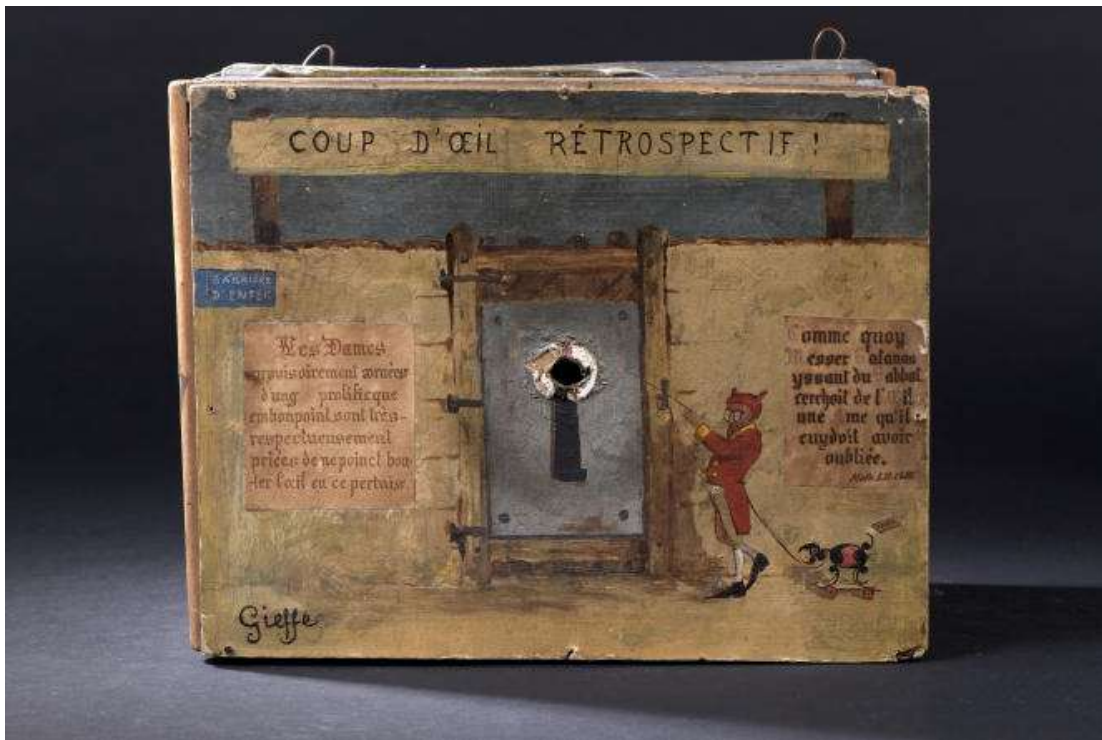
« Coup d'œil rétrospectif. – Comme quoy Messer Satanas sortant du Sabbat cerchoit de l'œil une âme qu'il croyait avoir oubliée », de Gieffe (pseudonyme de Jules Foloppe), huile sur panneaux de carton formant boîte. GALERIE JOHANN NALDI

Du même encore, quatre bas-reliefs de bois teinté alignent des profils féminins et masculins, collection de type comique. Le caricaturiste Boquillon Bridet (1859-1886) et le peintre Paul-Eugène Mesplès (1849-1924), jadis connus pour ses planches d'histoire naturelle pour l'un, ses figures de danseuses et de courtisanes pour l'autre, figurent aussi dans l'ensemble, et là encore, il est facile de les retrouver dans les catalogues des Arts incohérents.